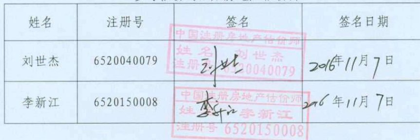
参与估价的注册房地产估价师