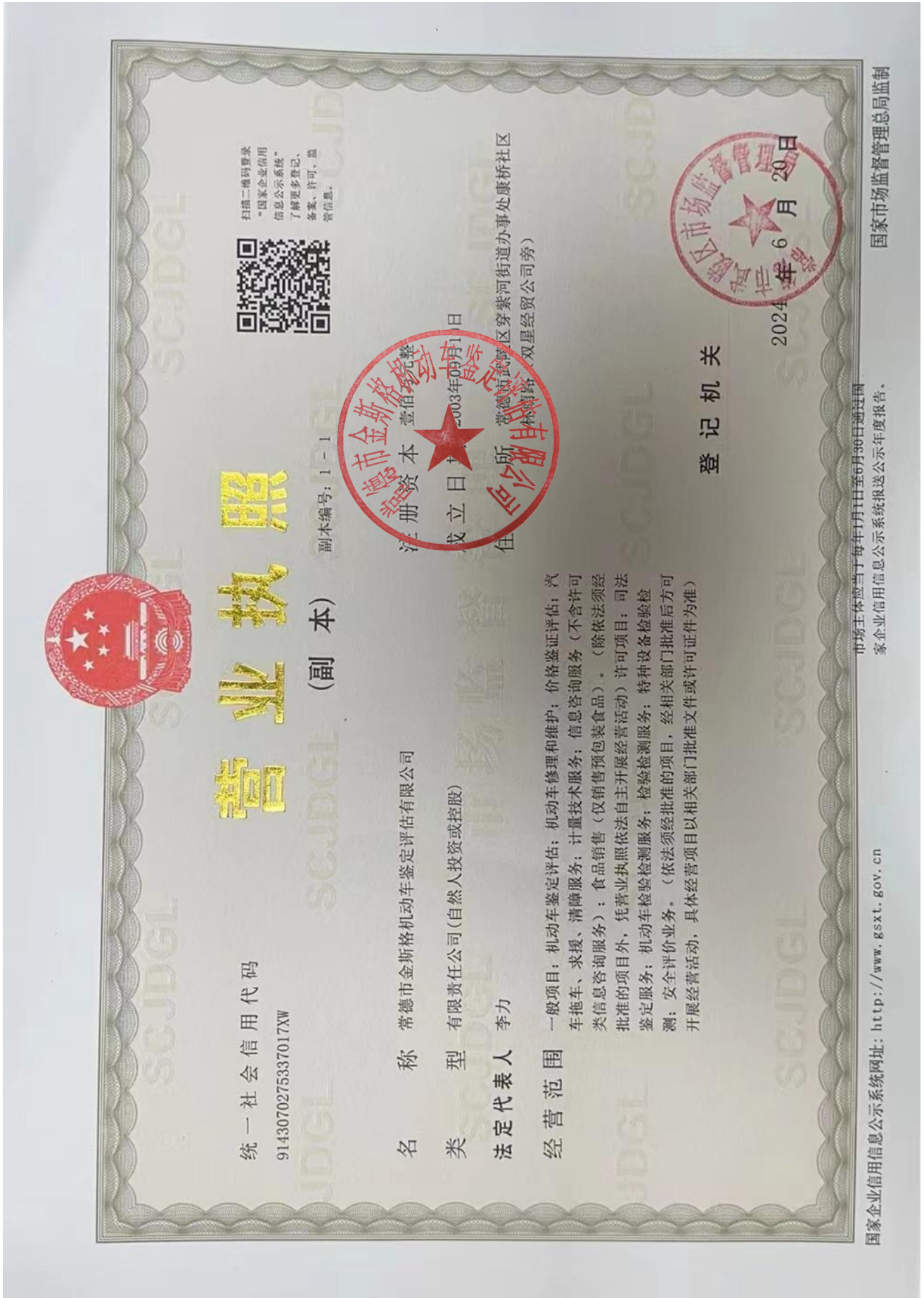
附件 4： 鉴定评估机构及鉴定评估人员资质证书