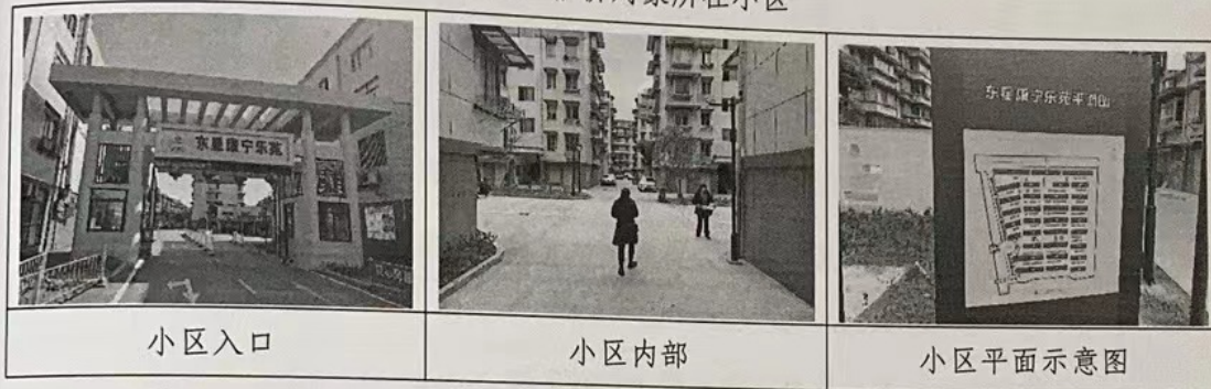
图1：估价对象所在小区