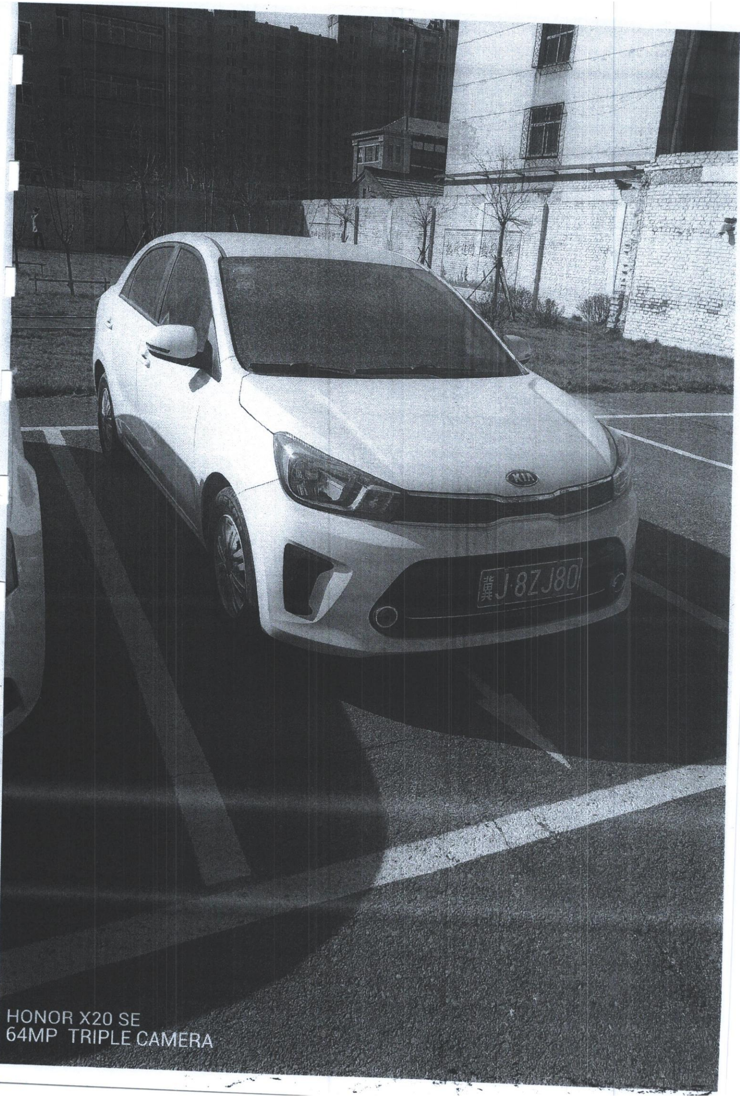
HONOR X20 SE 64MP TRIPLE CAMERA