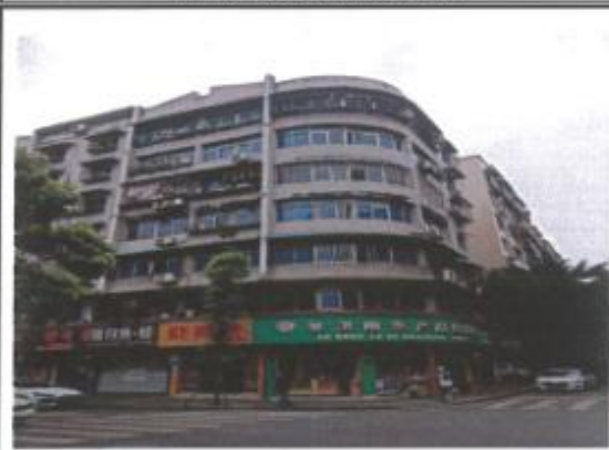
估价对象大楼外观