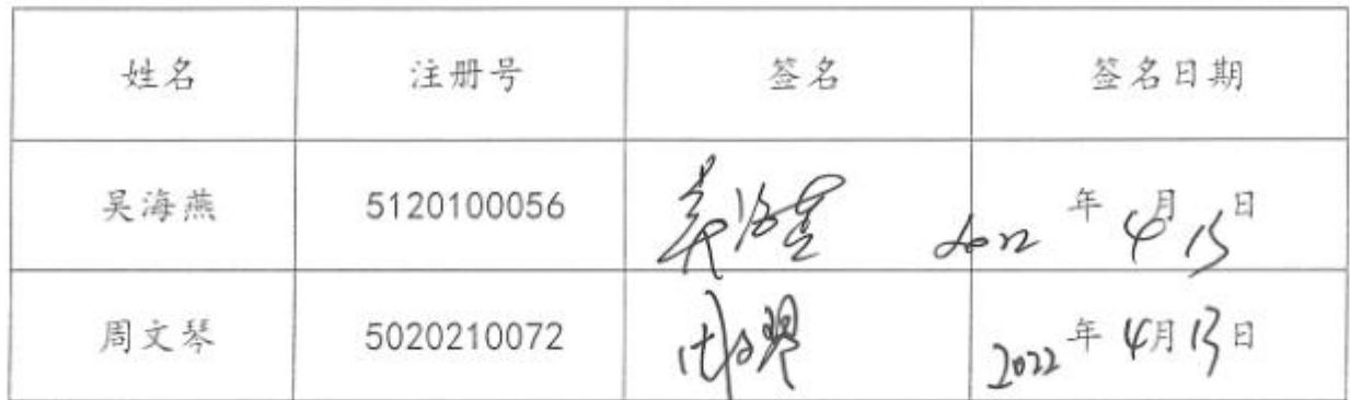
表 2 参加估价的注册房地产估价师