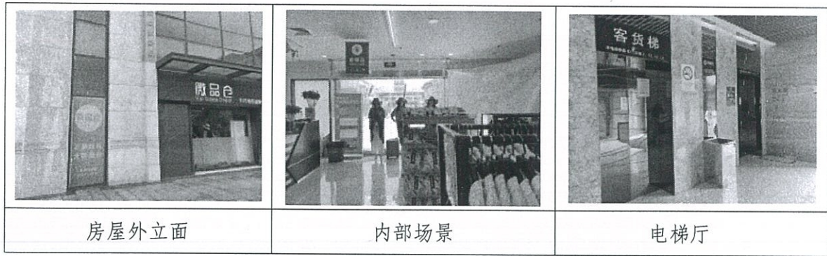
图 4：估价对象所在建筑物