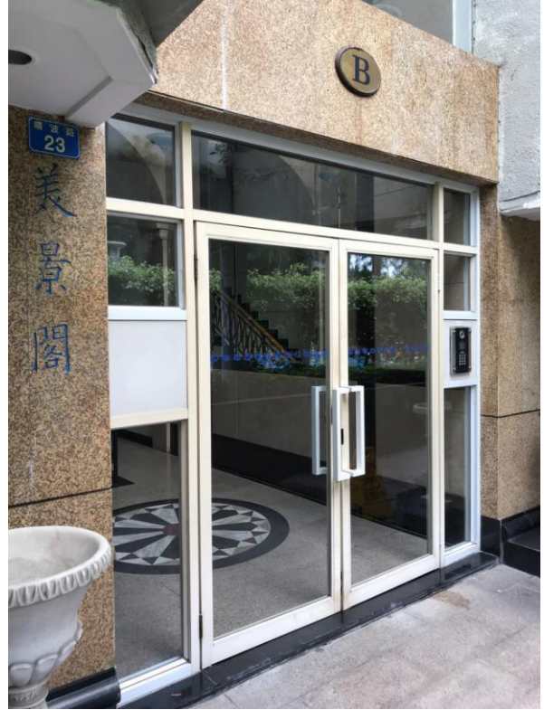
标的所在楼宇入口