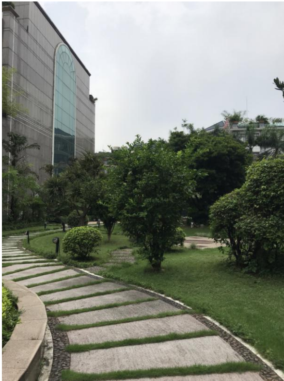
标的所在小区内部环境