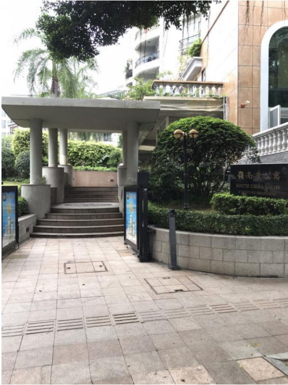
标的所在小区入口