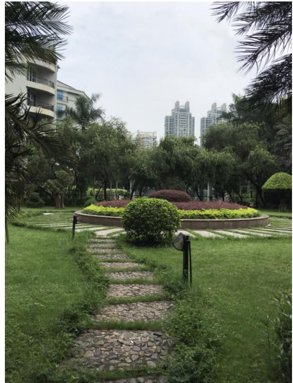
标的所在小区内部环境