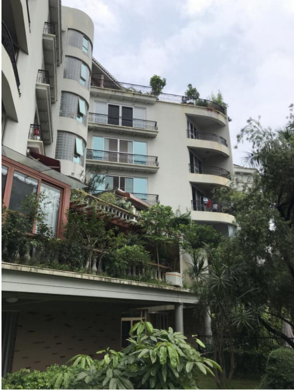
标的所在楼宇外观