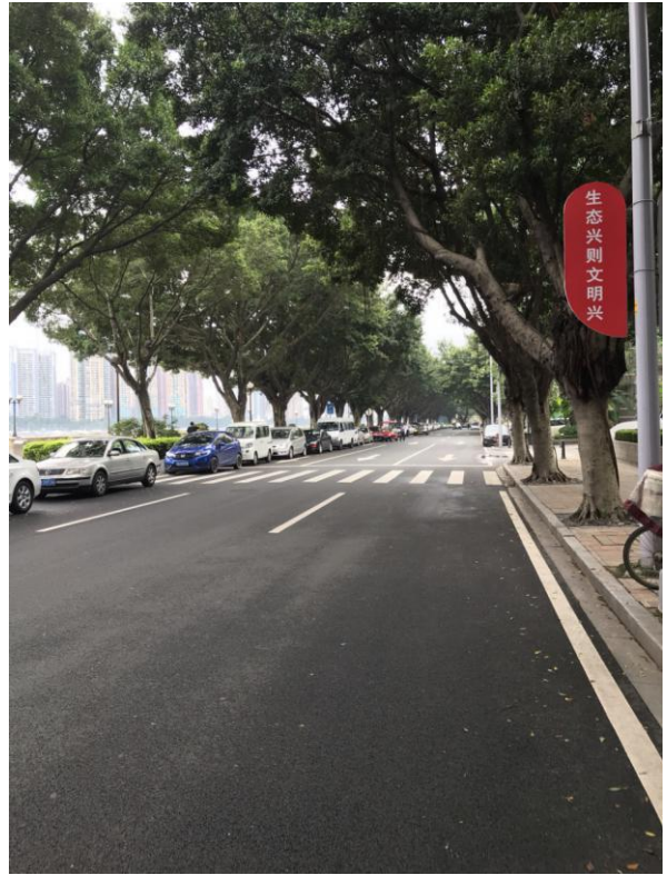
标的所在小区周边环境