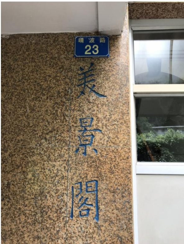
标的所在楼宇门牌号