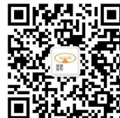
扫描关注恒通评估订阅号