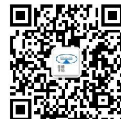
扫描关注恒通评估服务号