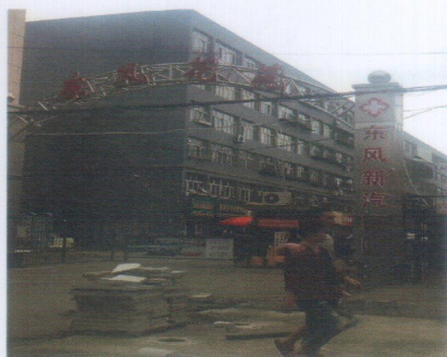
北京北路59号（东风花苑）

墙面为抹灰刷白，左侧为铁质栏杆扶手，未配备电梯，估价对象6层602室入户门为老式木门，装有老式格栅铁艺防盗门，因无法进入室内，房屋装修情况不详。