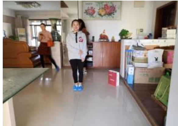
注册房地产估价师照片 2