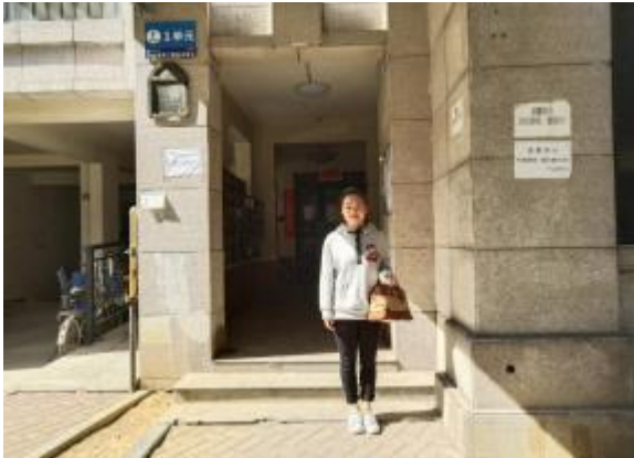
注册房地产估价师照片 1