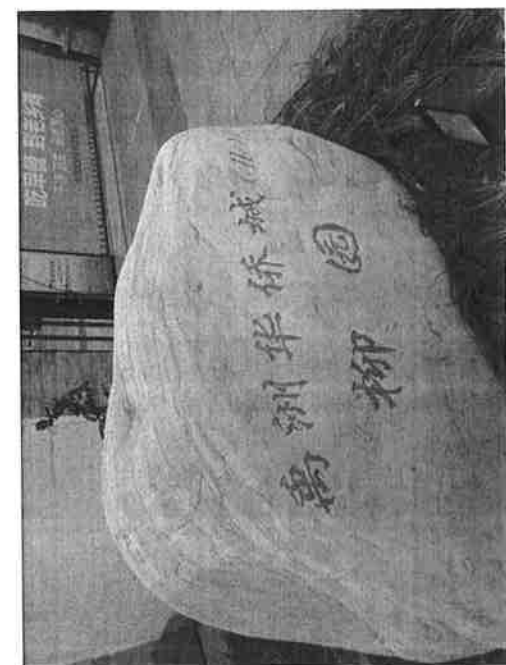
估价对象实物现状图