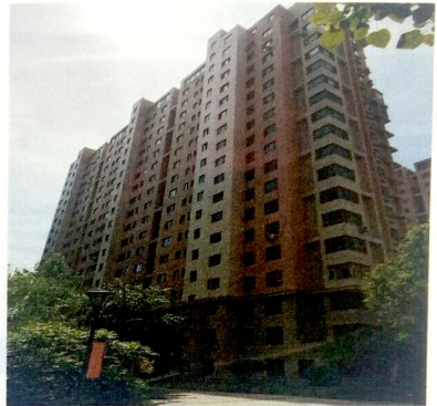
和枫雅居 9 栋