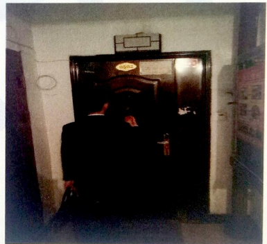
9 栋 5 层 1 单元 502