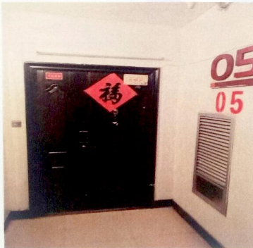
9 栋 5 层 1 单元 501