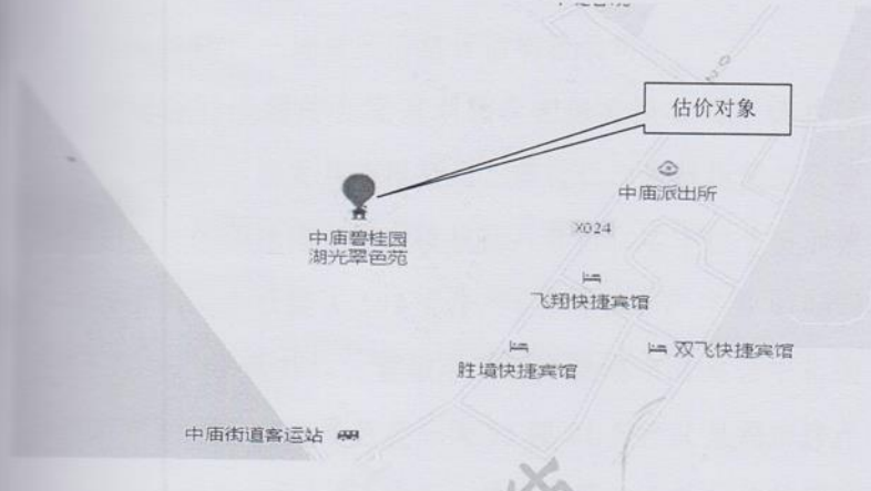
估价对象位置示意图