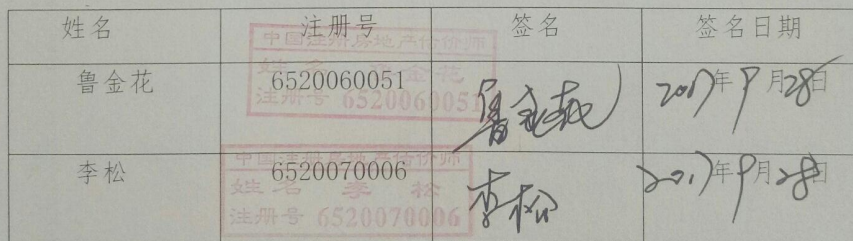
参加估价的注册房地产估价师