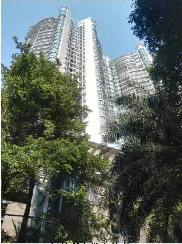
标的所在楼宇外观