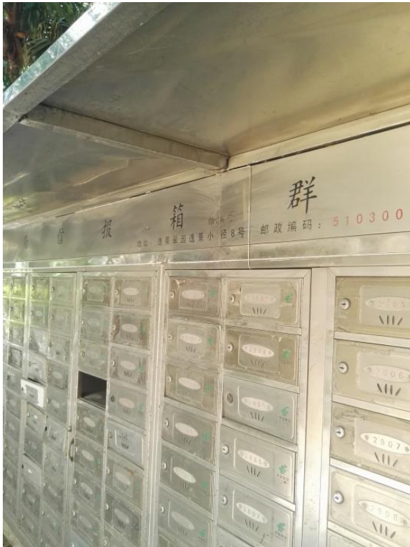
标的所在楼宇邮箱