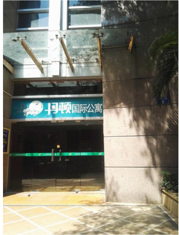
标的所在楼宇入口